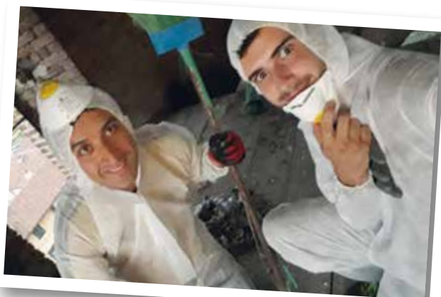
Gruppo Alpini di Moretta

Un caro saluto ai giovani di Patù, paese da cui proviene don Gianluigi e ospiti della settimana comunitaria organizzata dai ragazzi dell'oratorio, che sono saliti sul campanile per la foto di gruppo in mezzo alle campane morettesi e con il cappello alpino in testa.