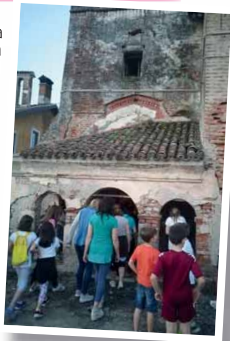
Associazione Famiglie Insieme

A malincuore abbiamo poi ripreso la via di Moretta, illuminati dai tradizionali flambeaux e con una bellissima sensazione di essere comunità viva, aperta al prossimo e in costante movimento.